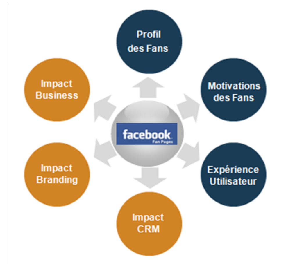
Grille analytique - 6 dimensions : Valeur des Fans sur Facebook – Copyright CRM Metrix

Notre compréhension de la valeur des fans et du ROI que les marques peuvent tirer de leur présence sur Facebook, s'articule autour d'une grille analytique identique pour toutes les pages mais dont on adapte la focale en fonction des objectifs de chacune d'entre elles.